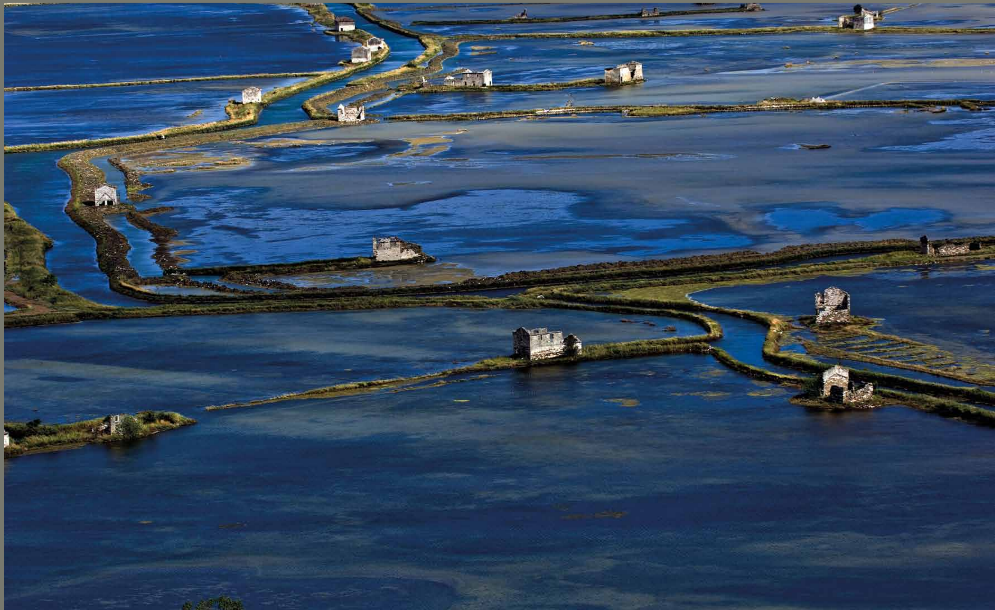
Fontanigge, stari del sečoveljskih solin / Slovenija

1 2 3 4 5 6 7 8 9 10 11 12 13 14 15 16 17 18 19 20 21 22 23 24 25 26 27 28 29 30 31