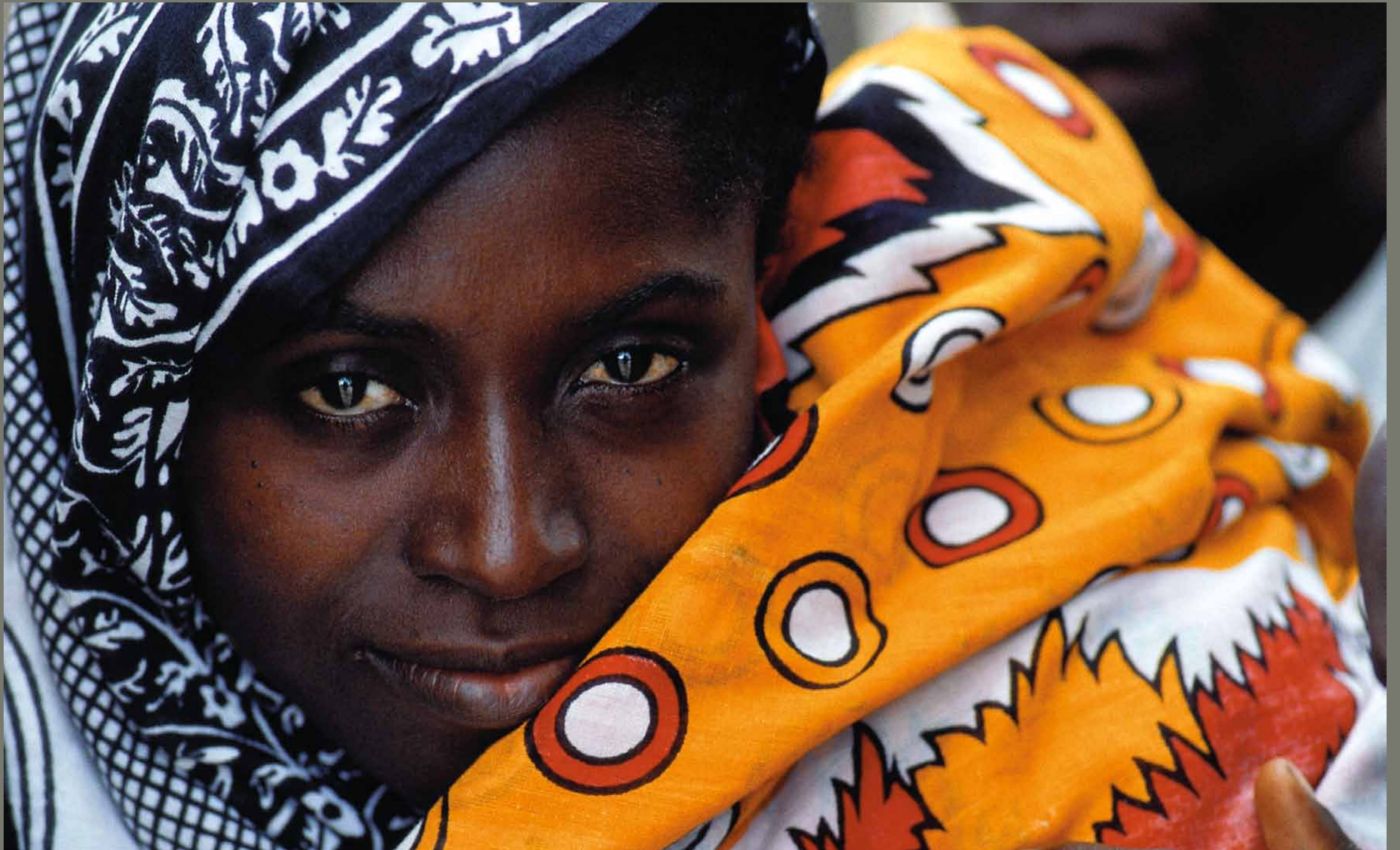
Stone Town na Zanzibarju / Tanzanija

1 2 3 4 5 6 7 8 9 10 11 12 13 14 15 16 17 18 19 20 21 22 23 24 25 26 27 28