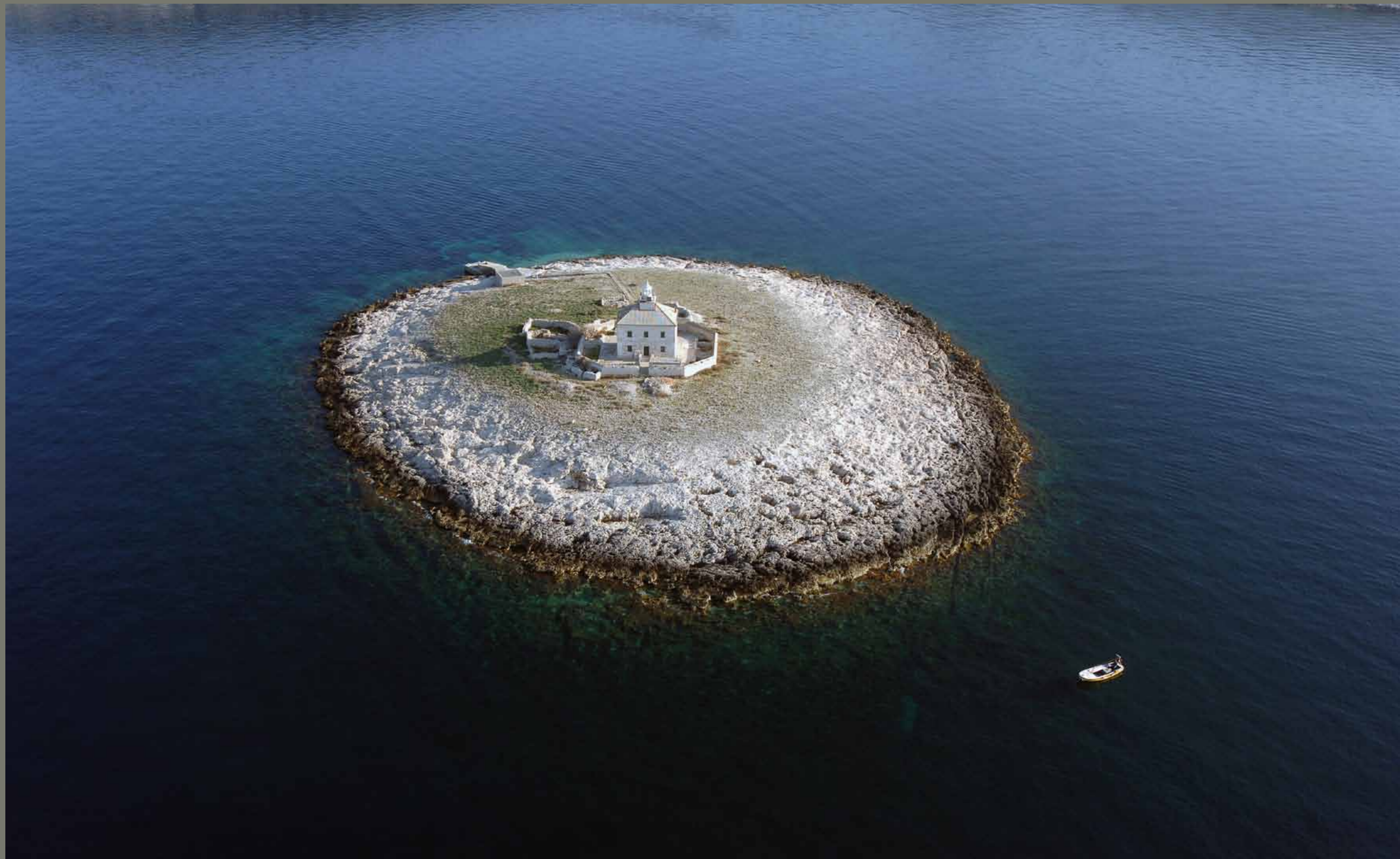
Svetilnik Pokonji dol pri Hvaru / Hrvatska

1 2 3 4 5 6 7 8 9 10 11 12 13 14 15 16 17 18 19 20 21 22 23 24 25 26 27 28 29 30 31