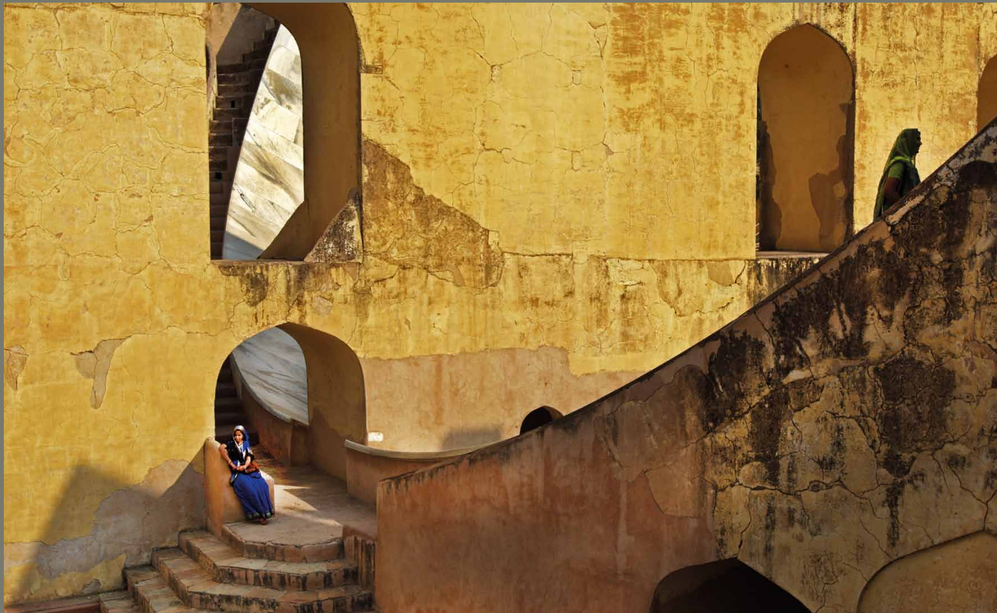
Astronomski observatorij Jantar Mantar / Indija

1 2 3 4 5 6 7 8 9 10 11 12 13 14 15 16 17 18 19 20 21 22 23 24 25 26 27 28 29 30 31