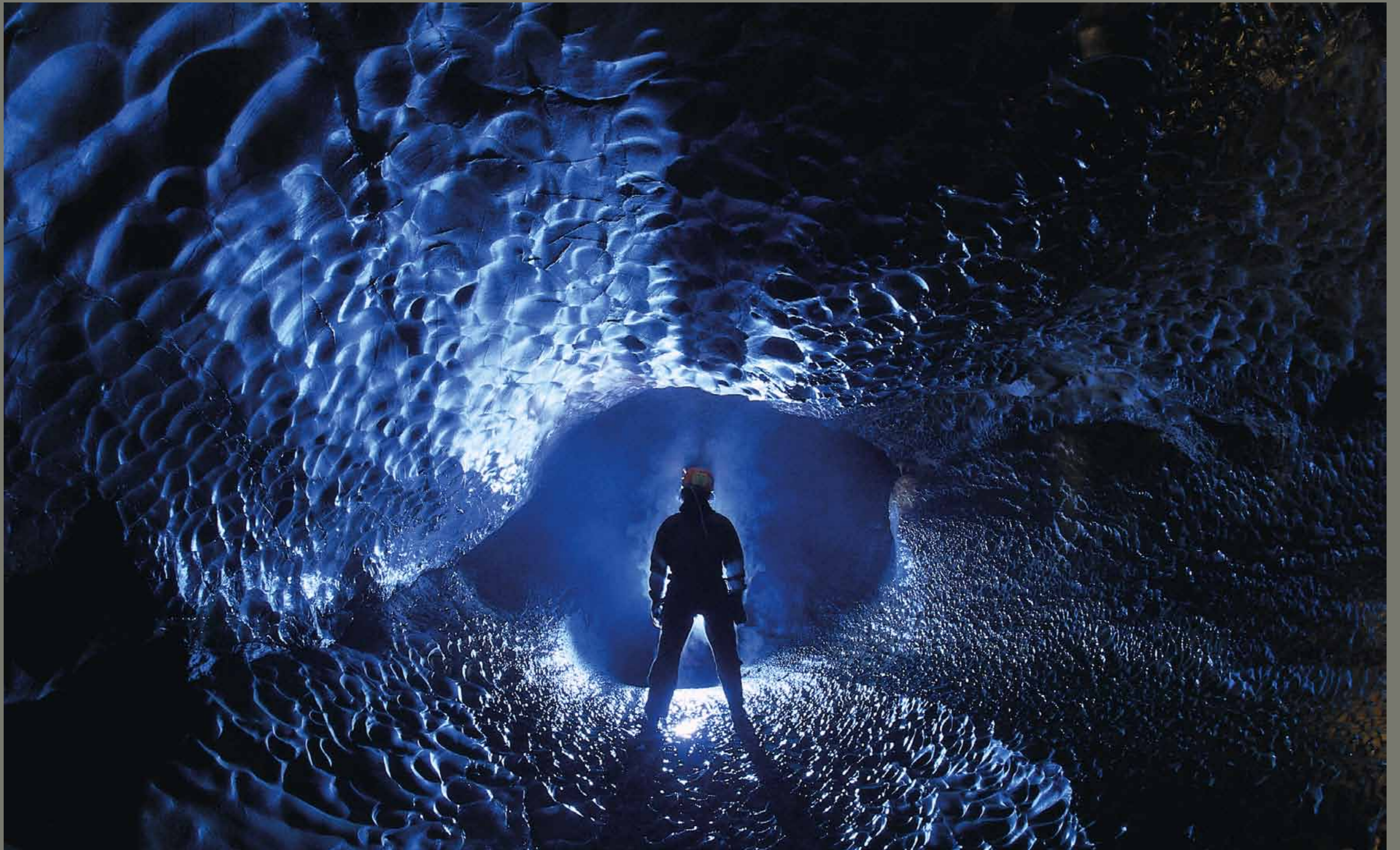
Vodna jama Markov spodmol pri Postojni / Slovenija