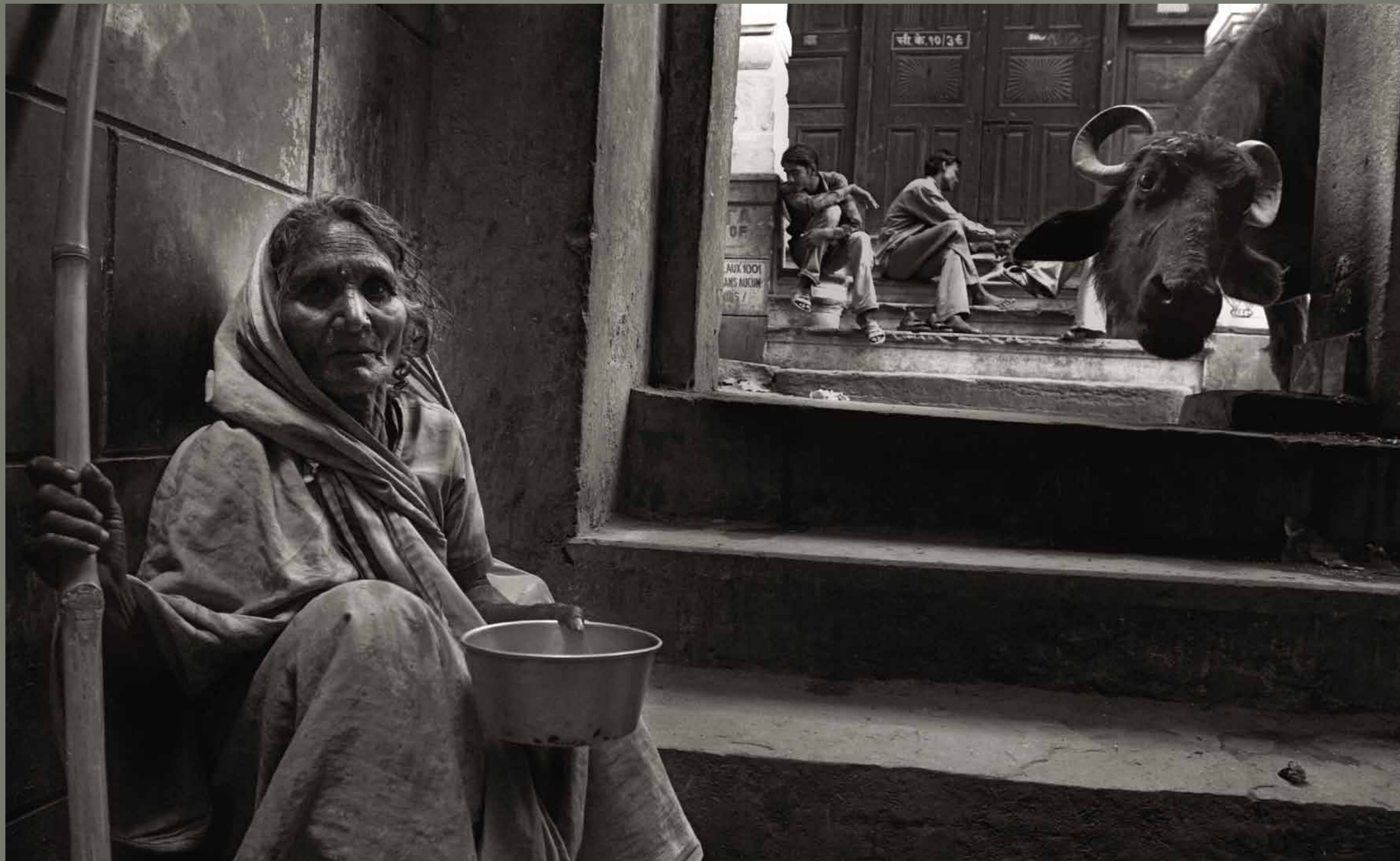
Beračica v romarskem mestu Varanasi / Indija

1 2 3 4 5 6 7 8 9 10 11 12 13 14 15 16 17 18 19 20 21 22 23 24 25 26 27 28 29 30 31