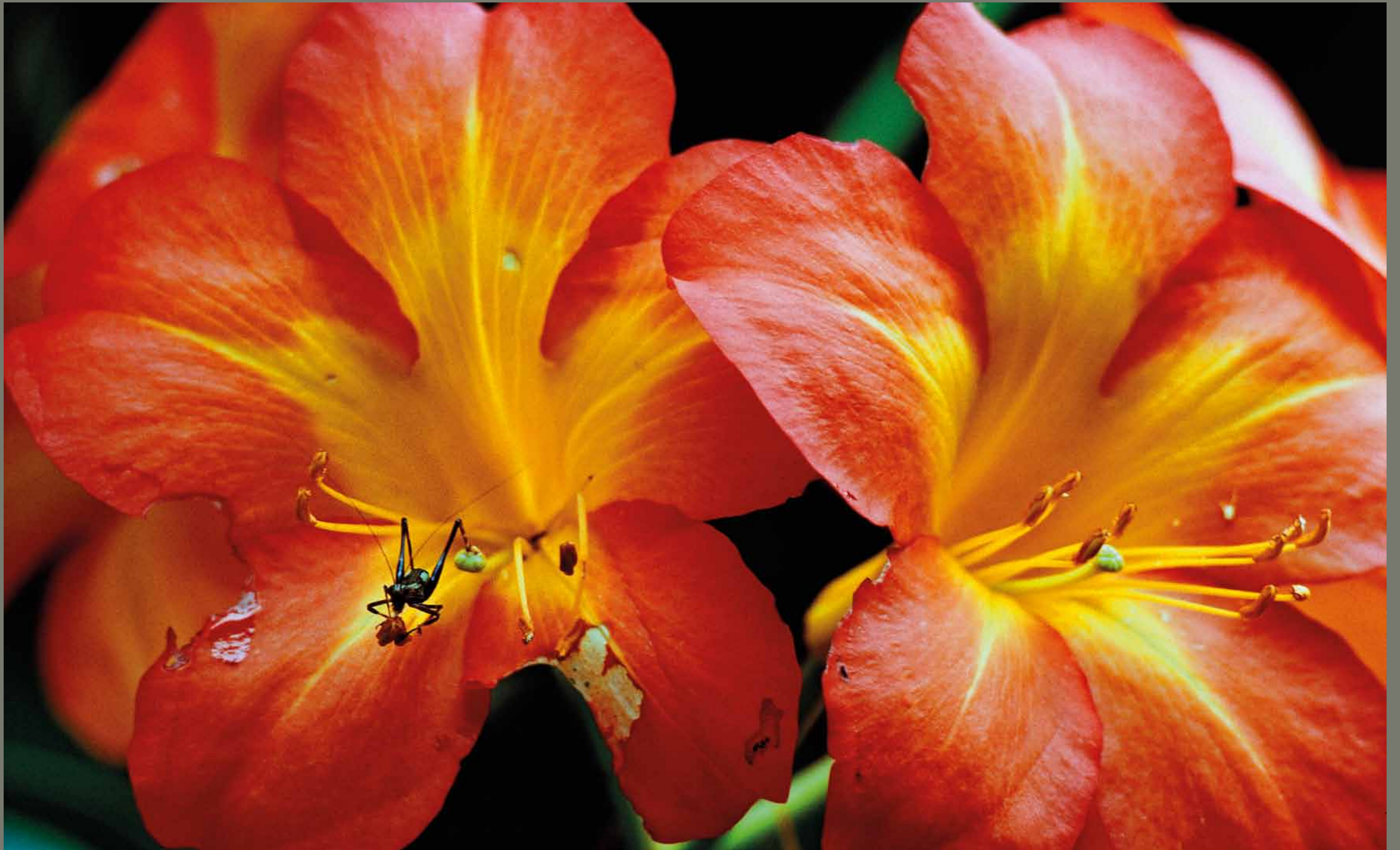
Višavje Goroka / Papua Nova Gvineja

1 2 3 4 5 6 7 8 9 10 11 12 13 14 15 16 17 18 19 20 21 22 23 24 25 26 27 28 29 30