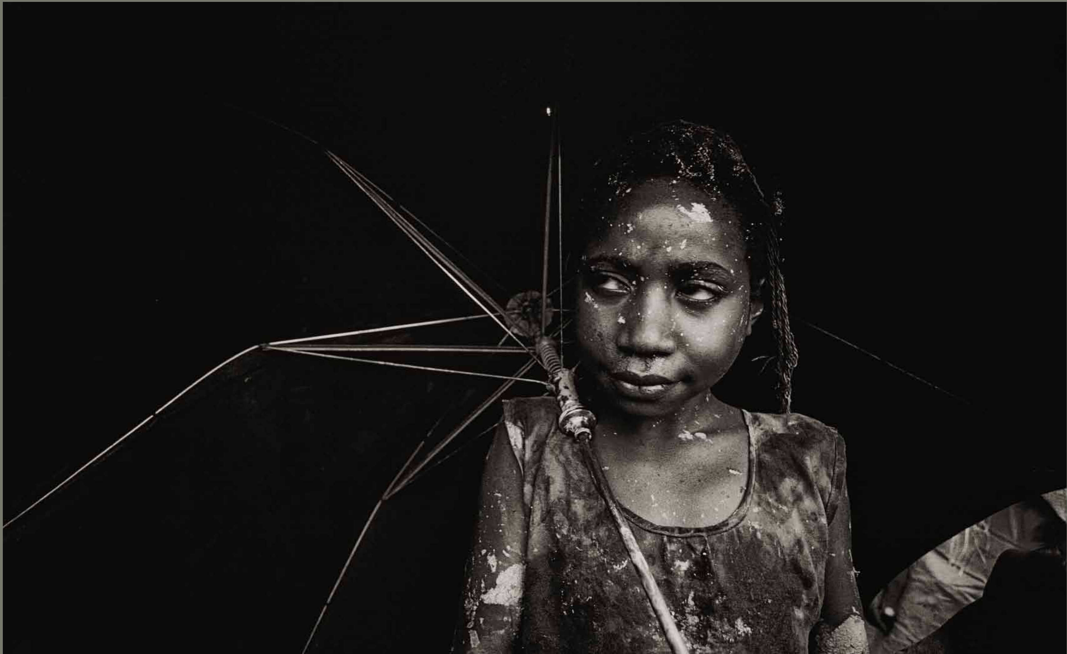
Zlatokopi na gori Mount Kare / Papua Nova Gvineja

1 2 3 4 5 6 7 8 9 10 11 12 13 14 15 16 17 18 19 20 21 22 23 24 25 26 27 28 29 30