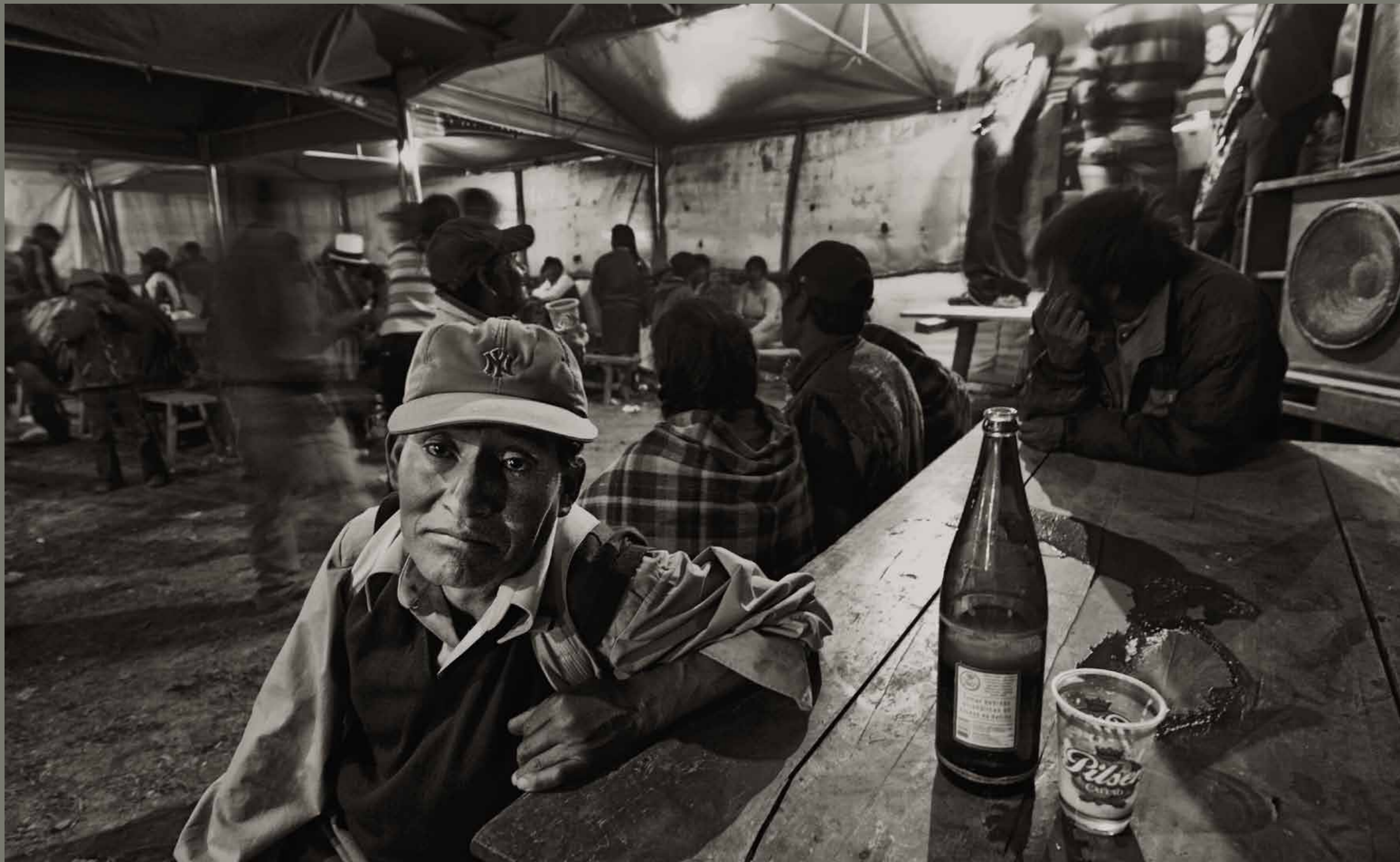
Praznovanje Marijinega nebovzetja v vasi Maras / Peru

1 2 3 4 5 6 7 8 9 10 11 12 13 14 15 16 17 18 19 20 21 22 23 24 25 26 27 28