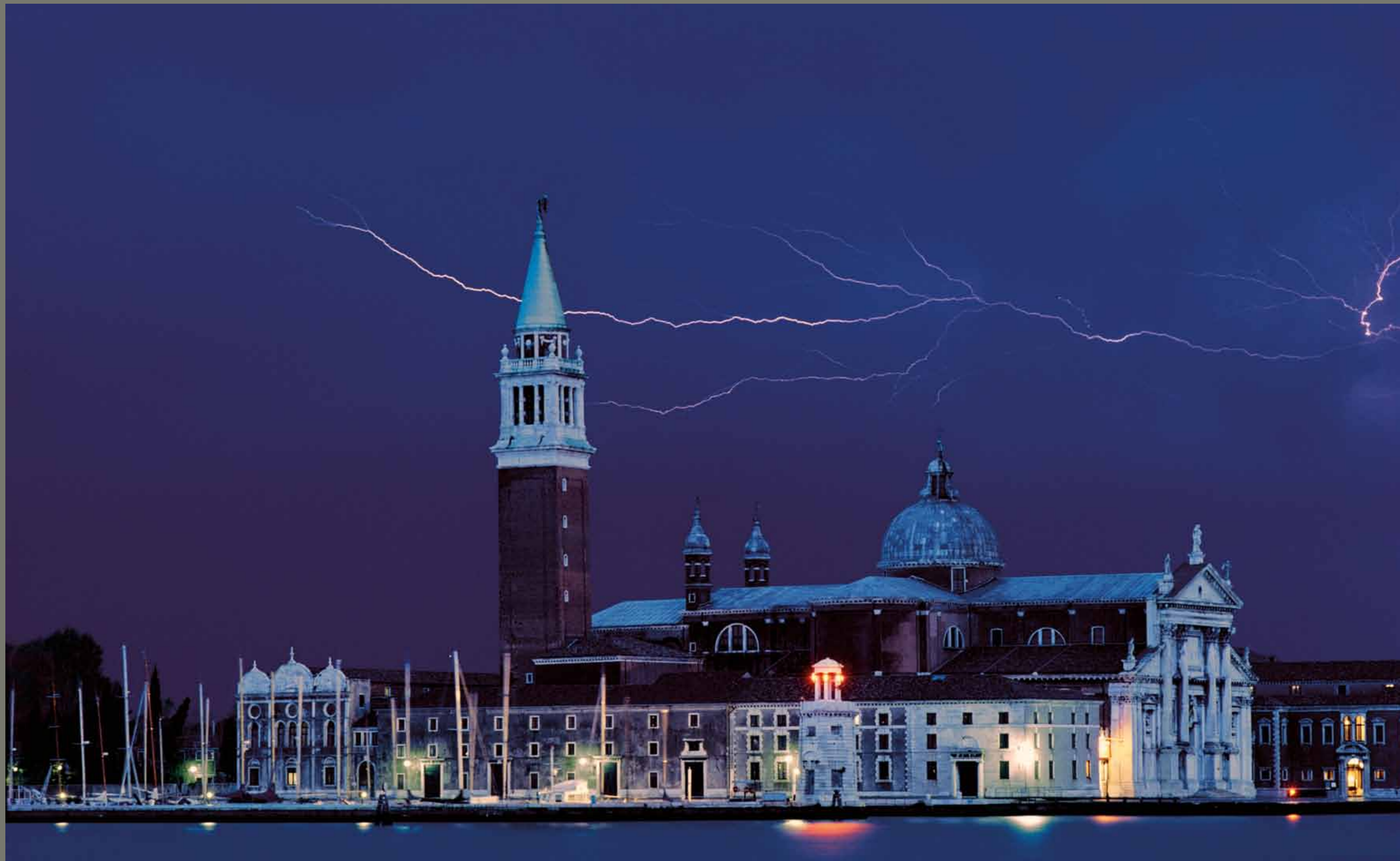
Otok in cerkev San Giorgio Maggiore v Benetkah / Italija

1 2 3 4 5 6 7 8 9 10 11 12 13 14 15 16 17 18 19 20 21 22 23 24 25 26 27 28 29 30