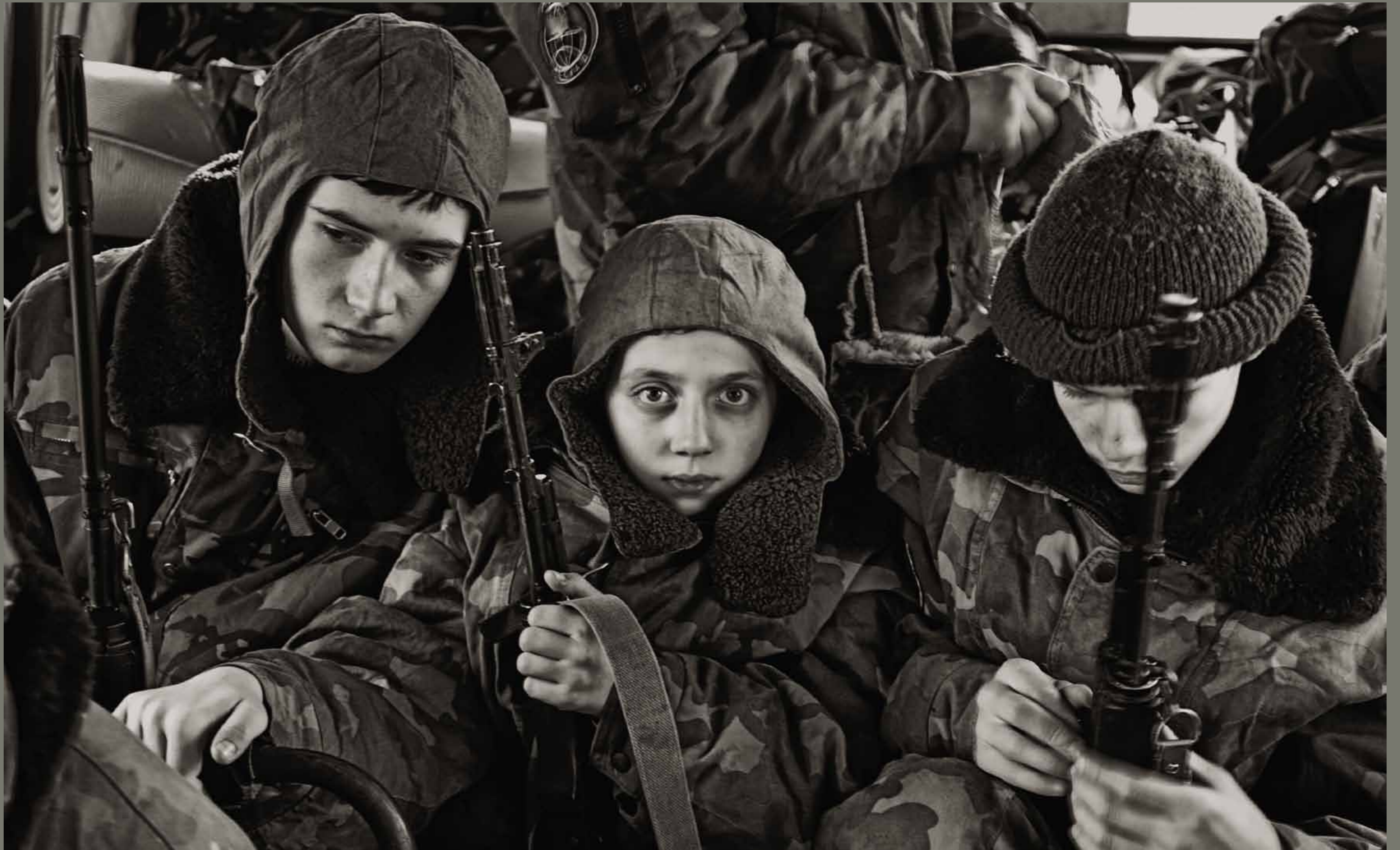
Ruski otroci na zimskem urjenju organizacije Kaskad / Rusija

1 2 3 4 5 6 7 8 9 10 11 12 13 14 15 16 17 18 19 20 21 22 23 24 25 26 27 28 29 30