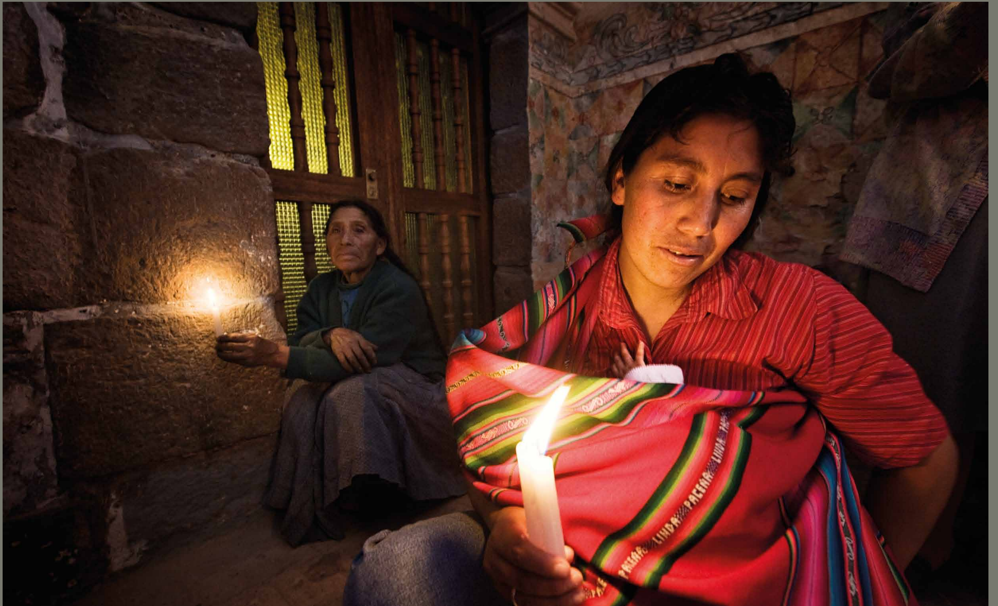
Praznovanje Marijinega nebovzetja v vasi Maras / Peru

1 2 3 4 5 6 7 8 9 10 11 12 13 14 15 16 17 18 19 20 21 22 23 24 25 26 27 28 29 30 31