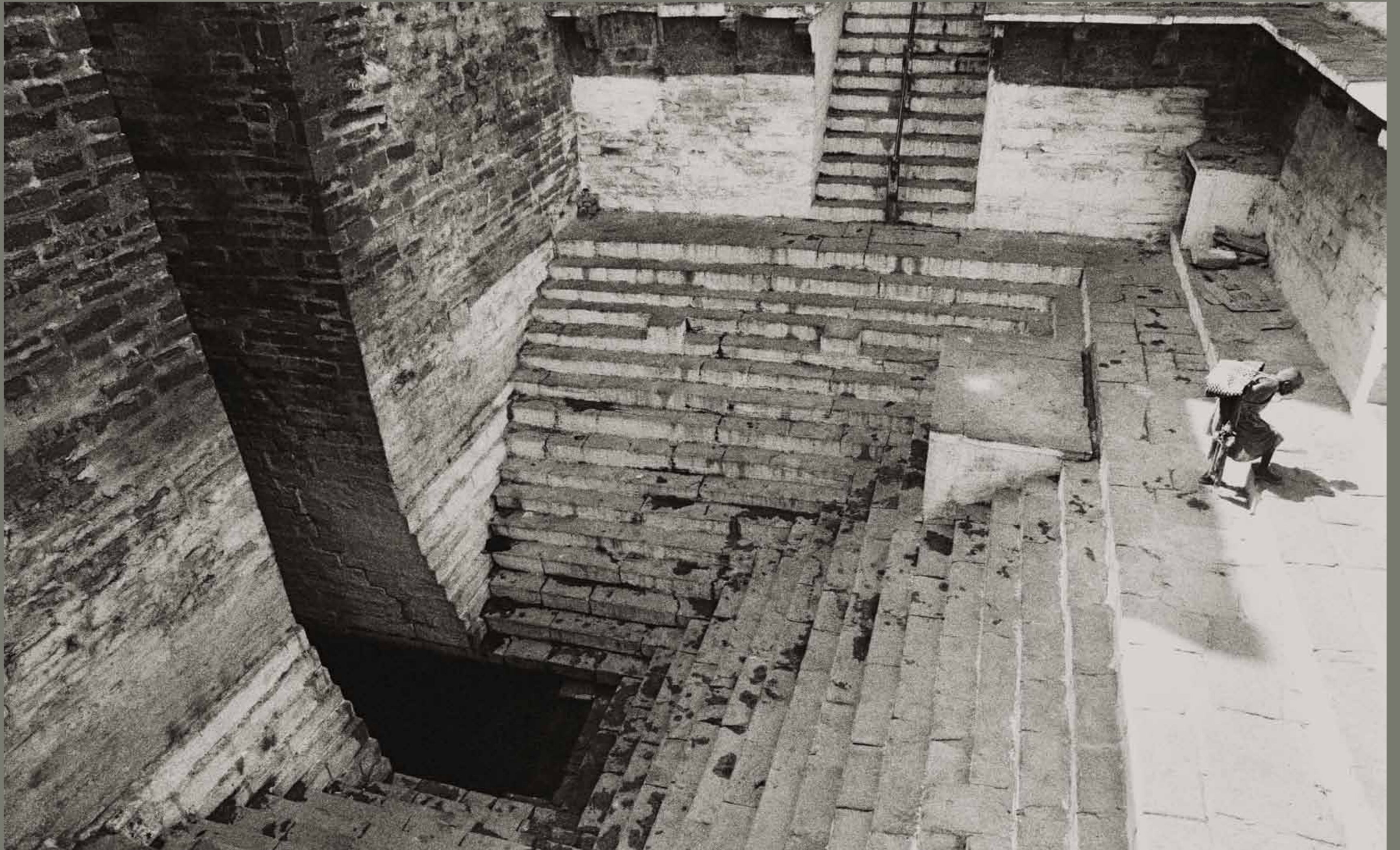
Vodnjak v romarskem mestu Varanasi / Indija

1 2 3 4 5 6 7 8 9 10 11 12 13 14 15 16 17 18 19 20 21 22 23 24 25 26 27 28 29 30 31