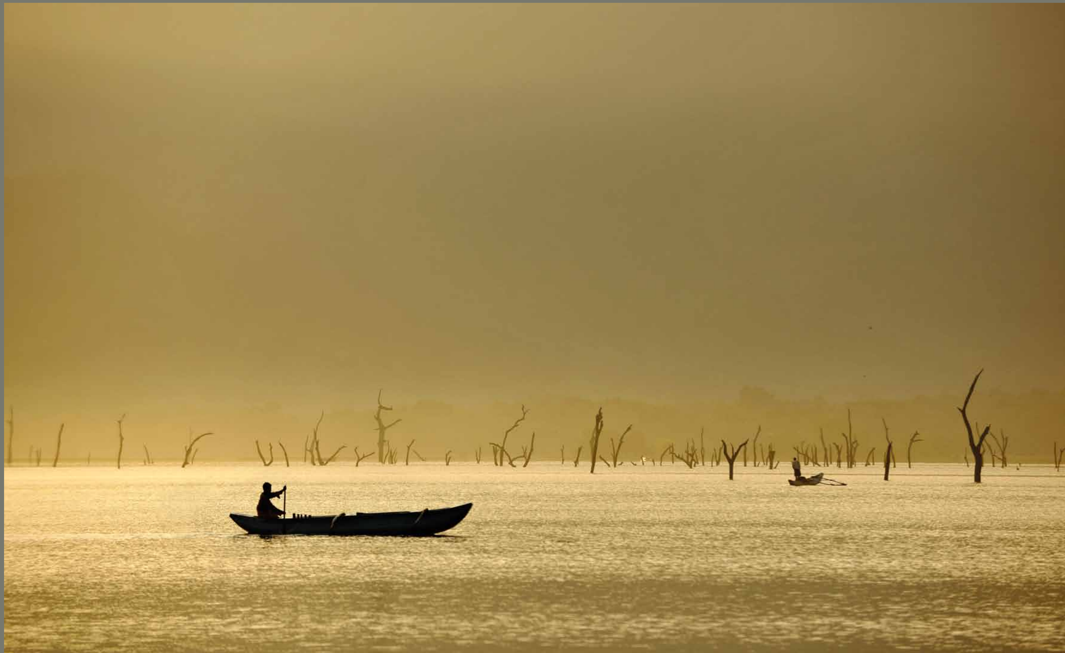
Umetno jezero Parakrama Samudra / Srilanka

1 2 3 4 5 6 7 8 9 10 11 12 13 14 15 16 17 18 19 20 21 22 23 24 25 26 27 28 29 30