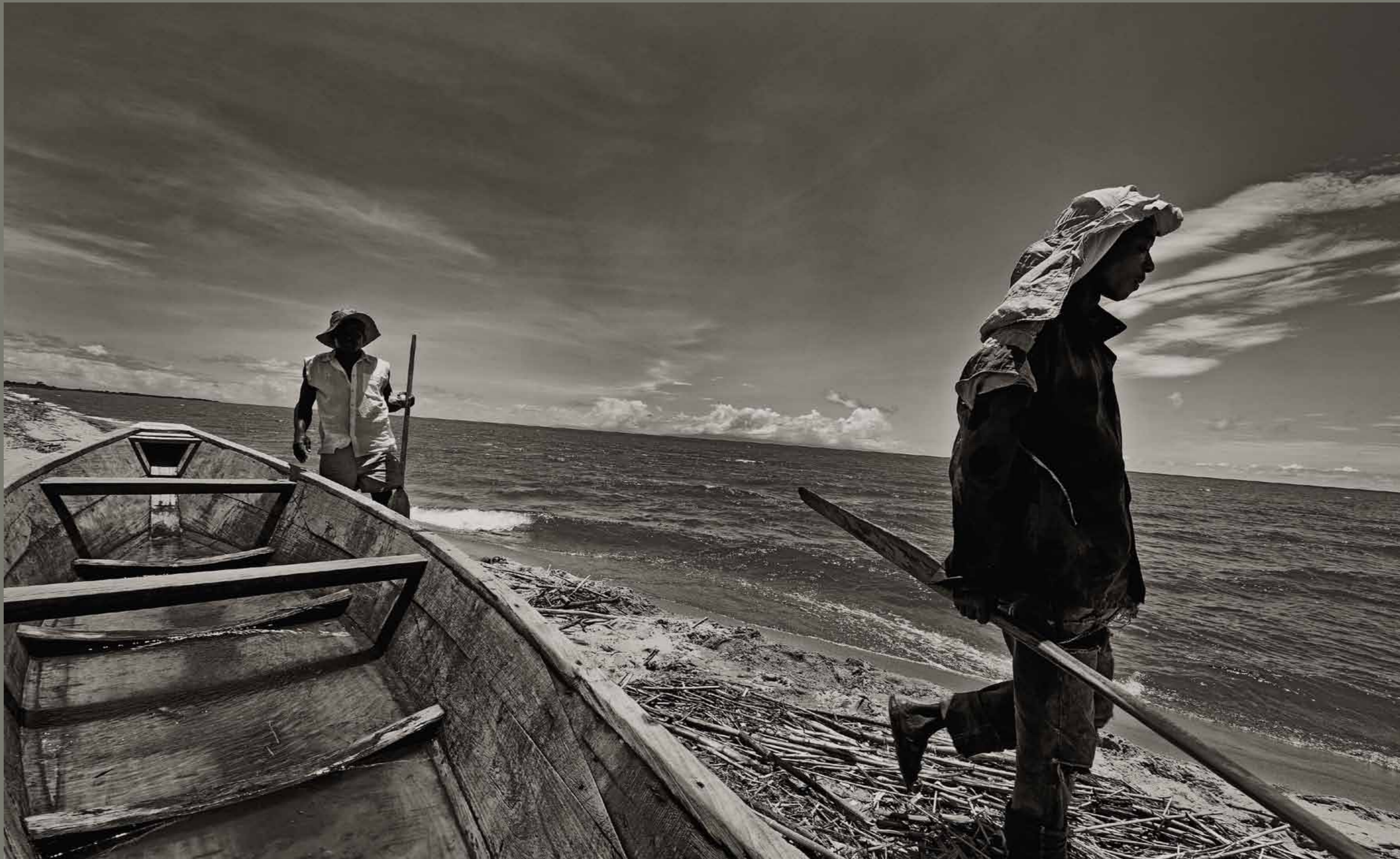
Jezero Tanganjika / Demokratska Republika Kongo

1 2 3 4 5 6 7 8 9 10 11 12 13 14 15 16 17 18 19 20 21 22 23 24 25 26 27 28 29 30 31