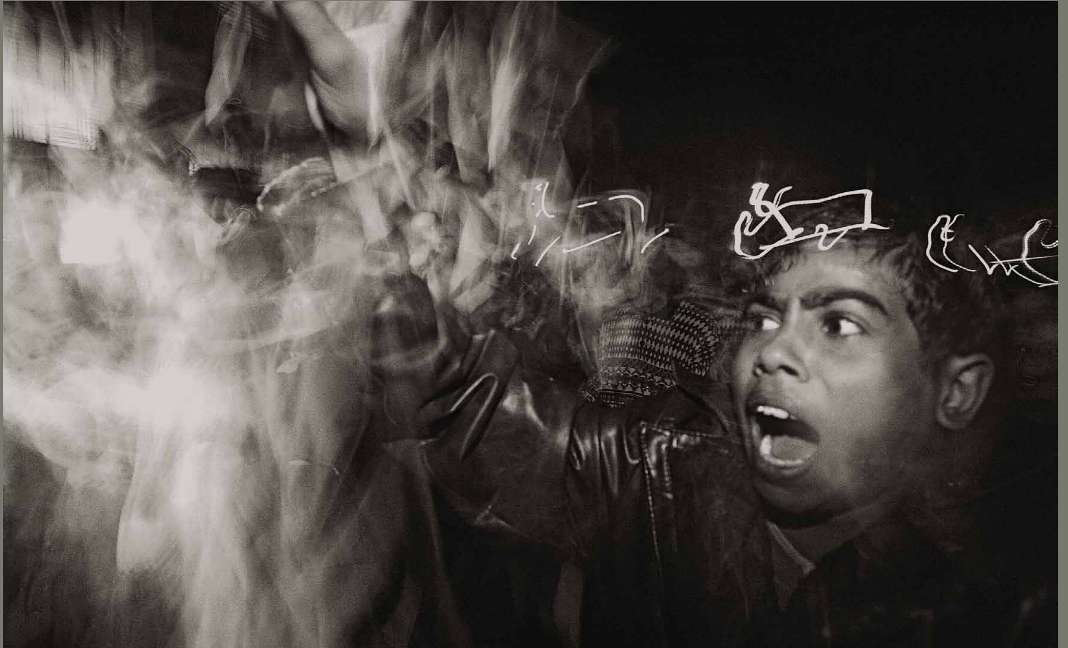
Intifada 2001, Gaza / Palestina

1 2 3 4 5 6 7 8 9 10 11 12 13 14 15 16 17 18 19 20 21 22 23 24 25 26 27 28 29 30 31