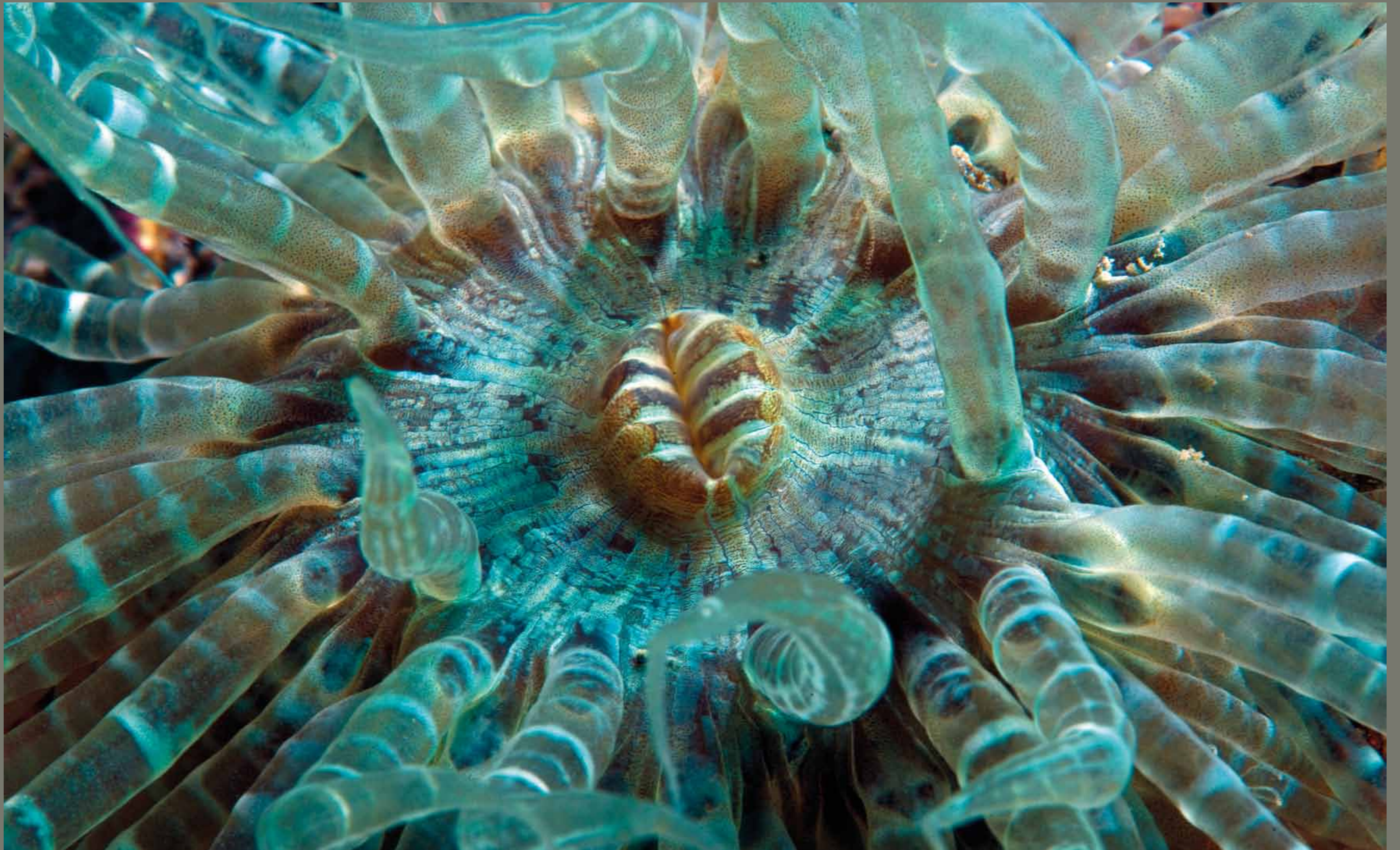
Morska vetrnica / Hrvatska

1 2 3 4 5 6 7 8 9 10 11 12 13 14 15 16 17 18 19 20 21 22 23 24 25 26 27 28 29 30