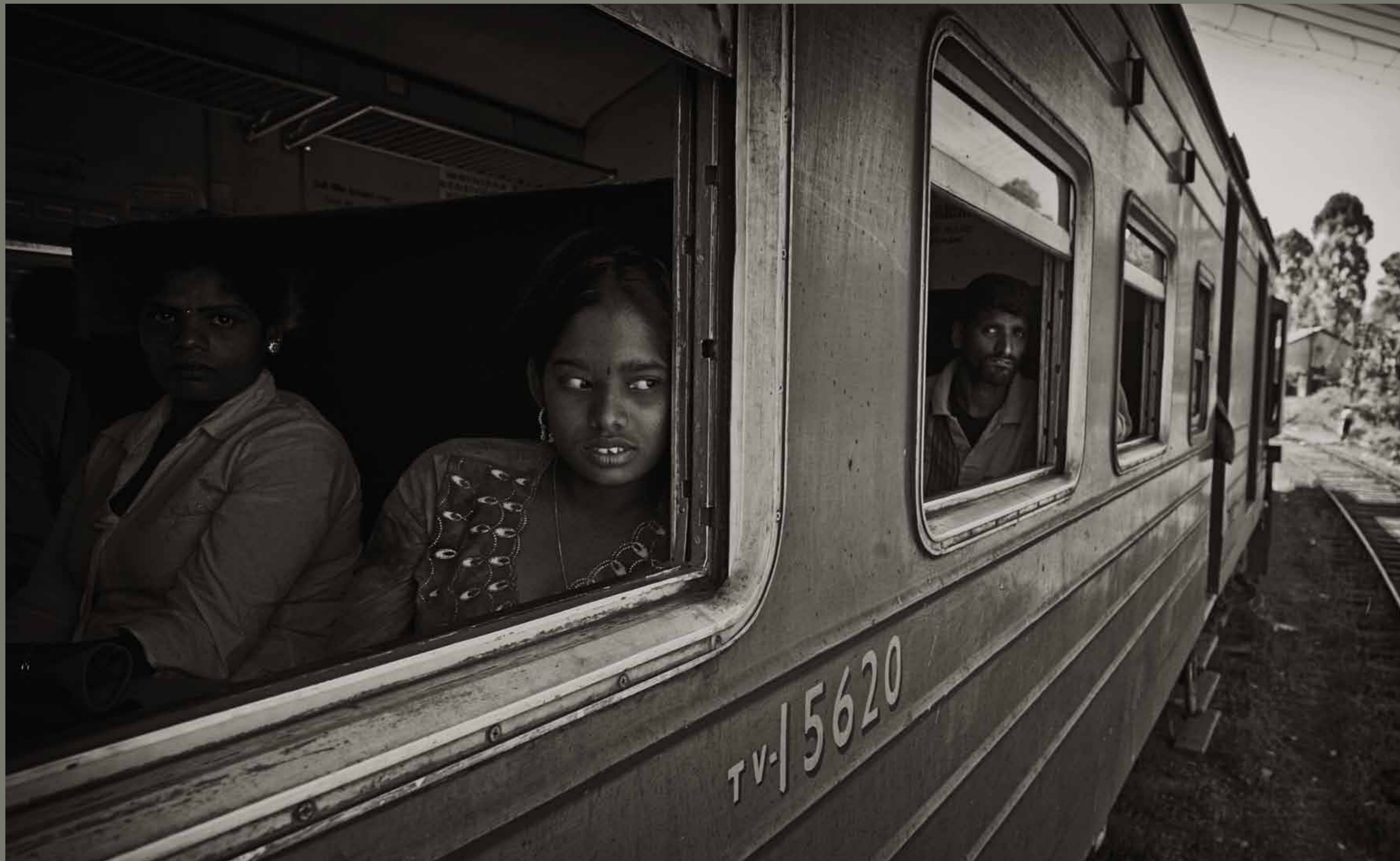
Vlak pri mestu Nuwara Eliya / Srilanka