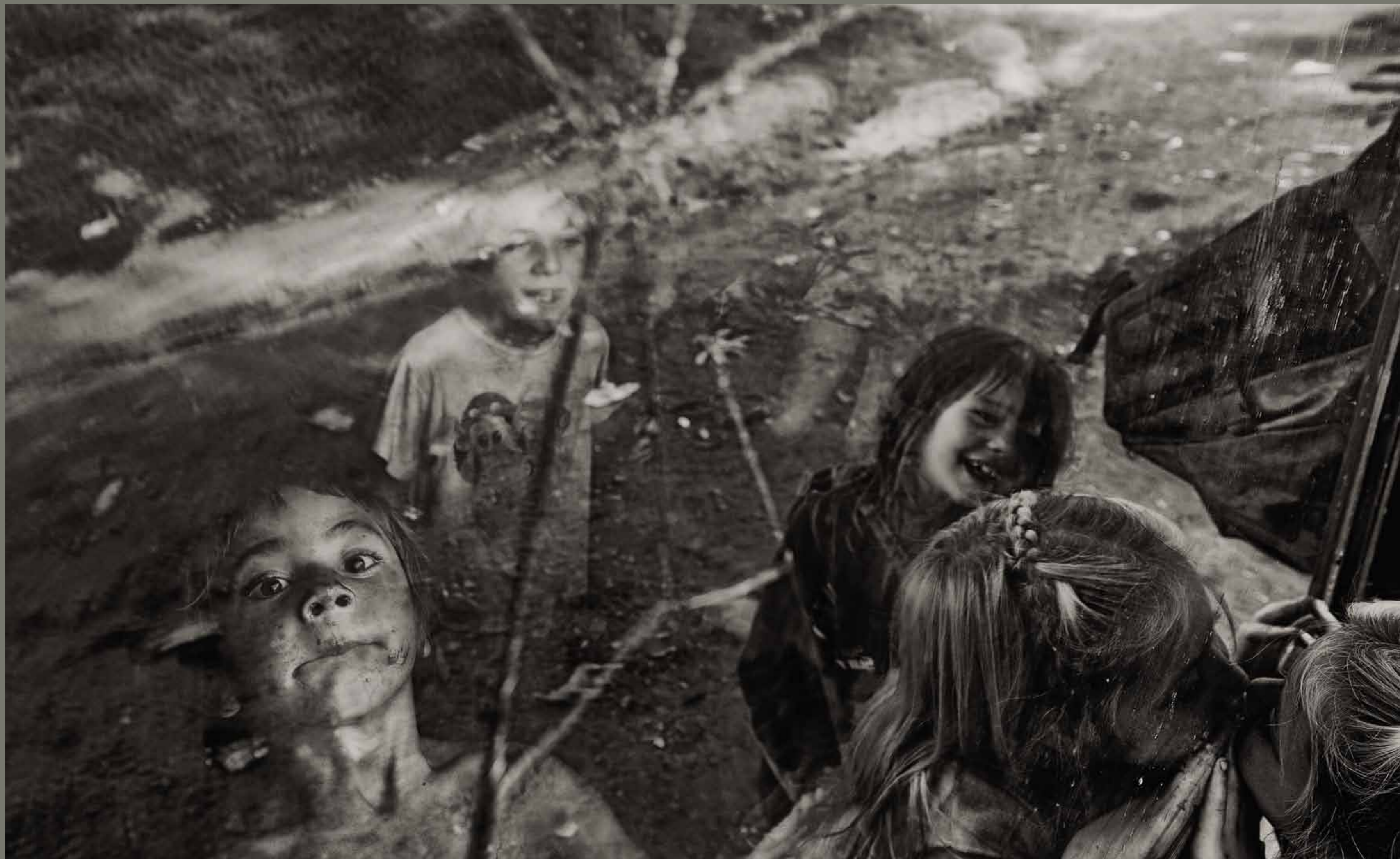
Romsko naselje Žabjek pri Novem Mestu / Slovenija