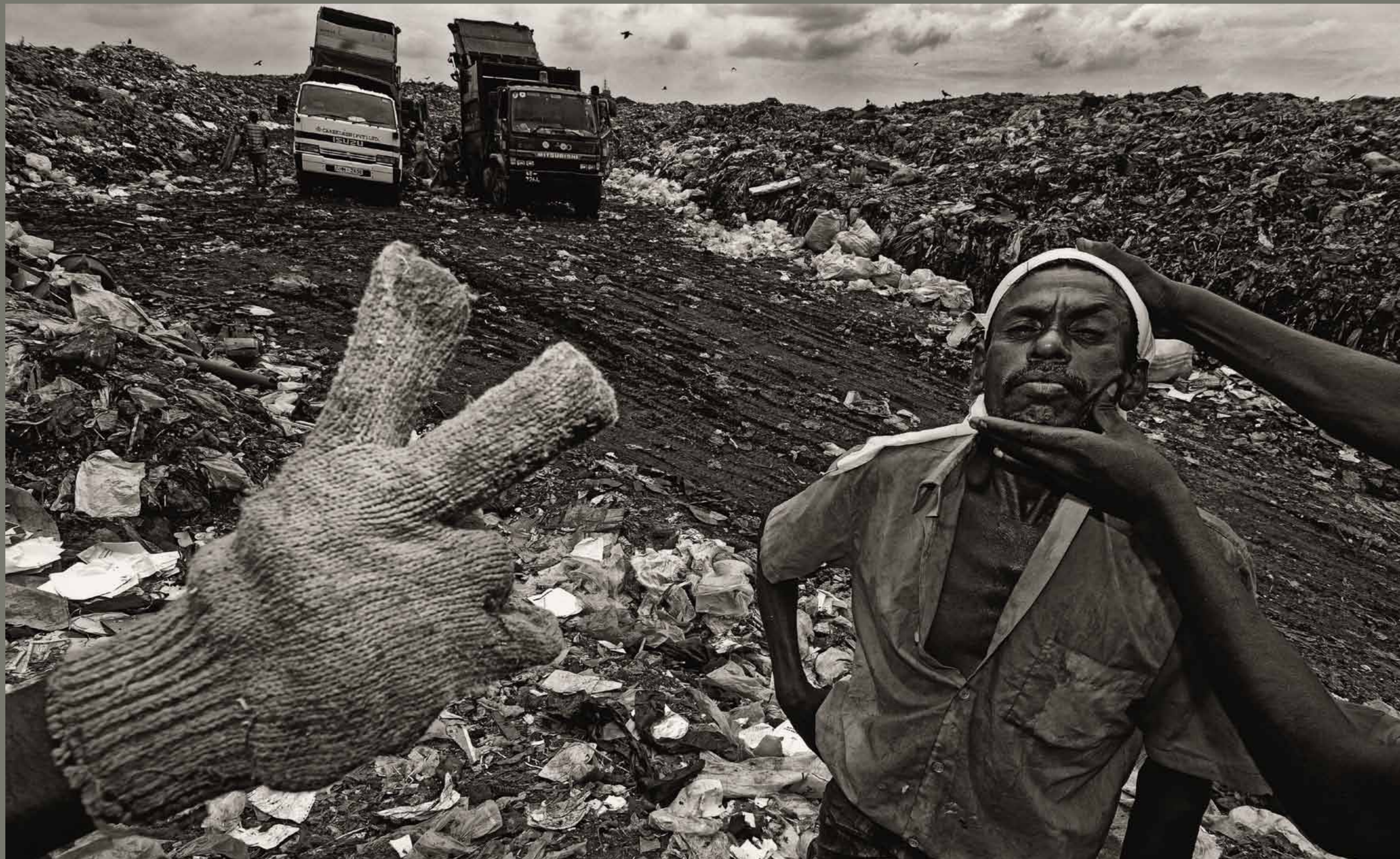
Smetišče Bloemendaal v Kolombu / Srilanka

1 2 3 4 5 6 7 8 9 10 11 12 13 14 15 16 17 18 19 20 21 22 23 24 25 26 27 28 29 30