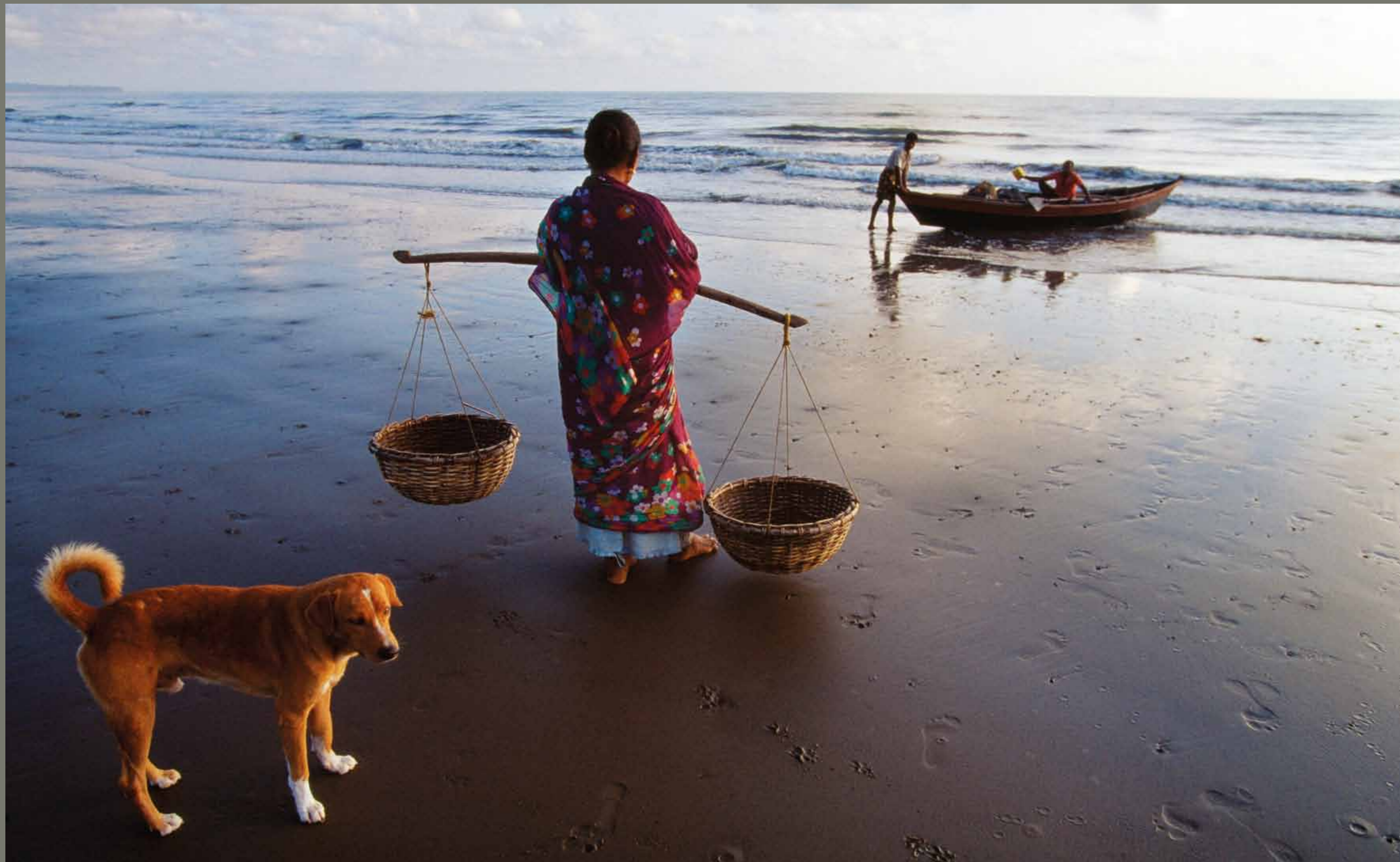
Andamansko otočje / Indija