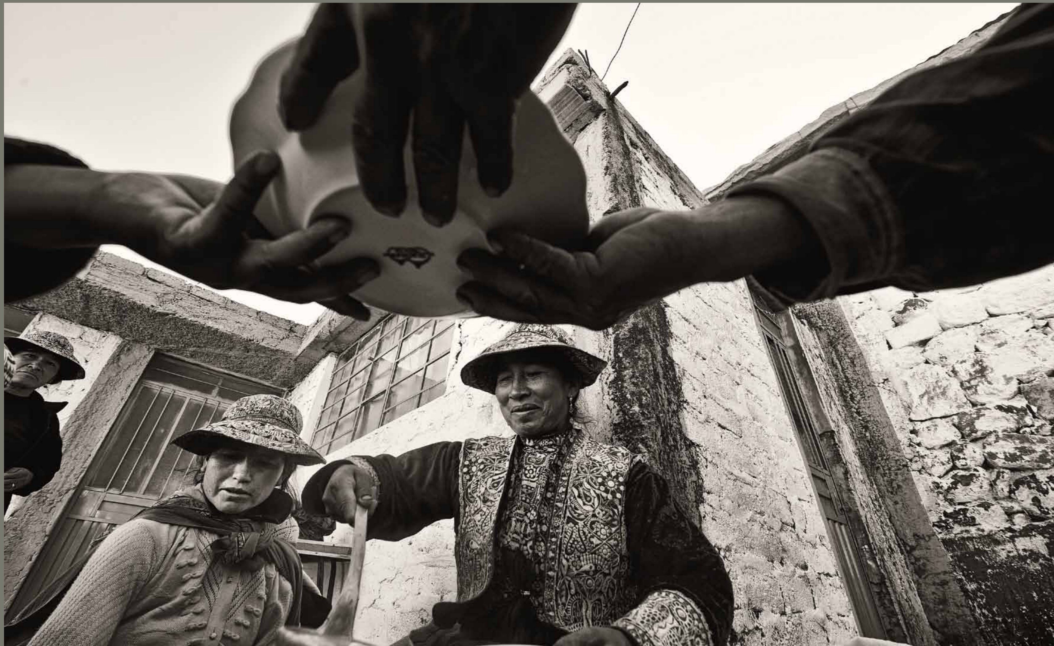
Festival Candelaria v mestu Chivay / Peru