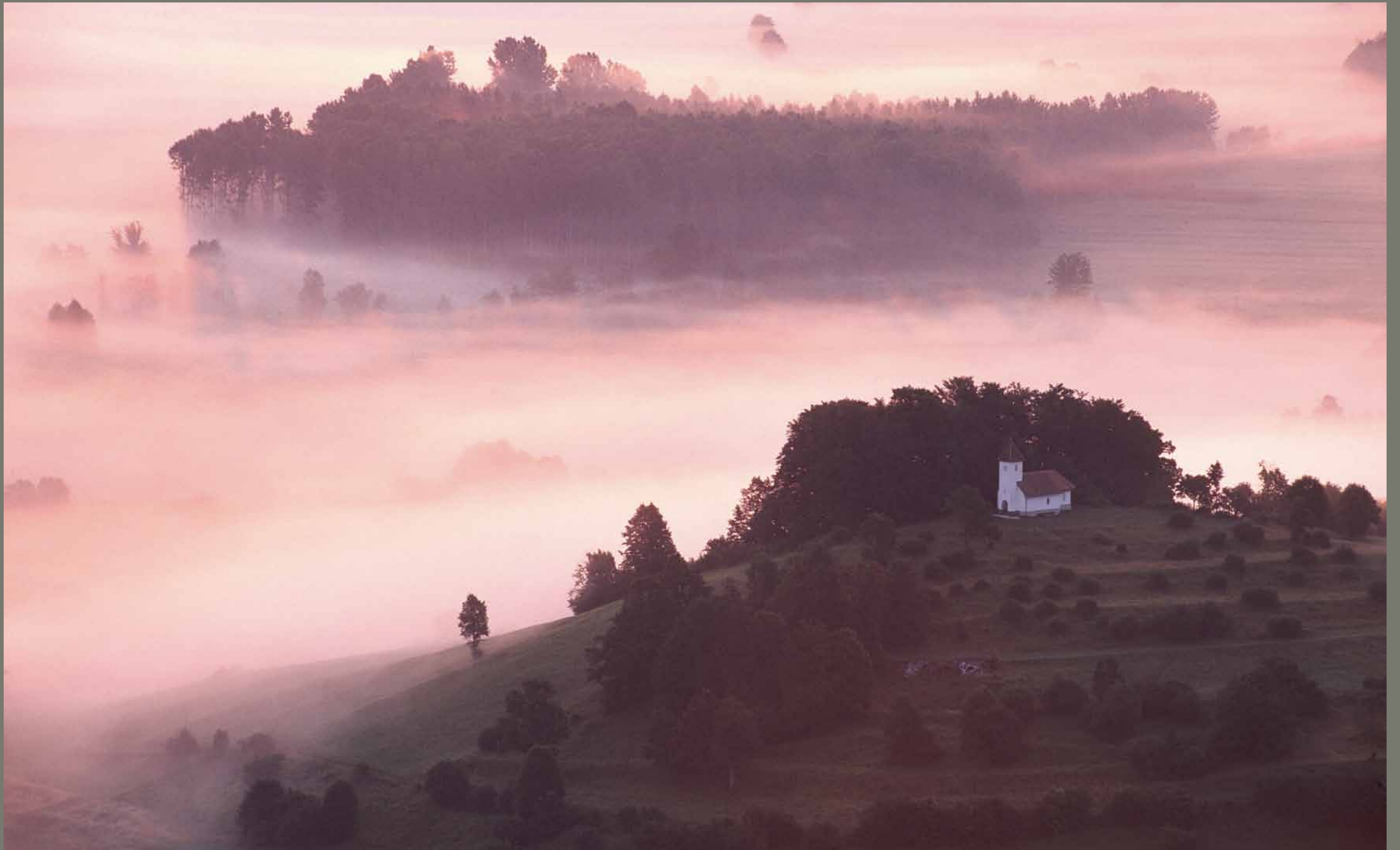
Cerkvica Sv. Jakoba na Barju pri Ljubljani / Slovenija