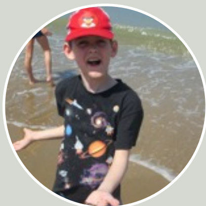
MIHA, 11 let

Zelo rad sem jedel v restavraciji, najraje pico. Všeč mi je bilo na Atomiumu in na morju.